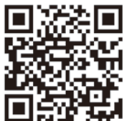
「優男がゆくのQRコード」