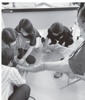
ラップを利用した 応急手当てを 学んでいるところ

また、 ボランティアの方々も募集 をしています。ご興味のある方はどうかご協力よろしく申し上げます。連絡は下記まで。