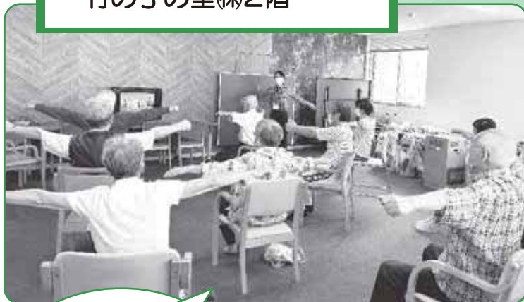
男性が多いので お気軽にどうぞ！