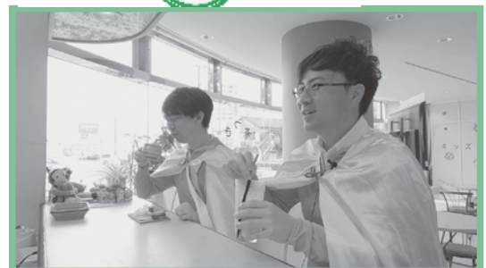
様々なドリンクを用意しております!! ぜひご利用ください!