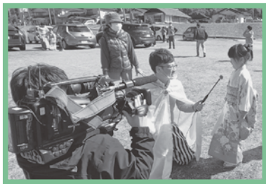
優男がゆく取材(木野地区)

社協の取り組みや地域のみなさんの日々の生きがいや活動を紹介するためにケーブルテレビちゅピCOM11チャンネルにて「優男がゆく」を放送しています。