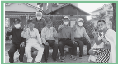
いつもご協力いただく地域のみなさんありがとうございます。