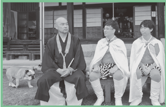
優男がゆく取材(西念寺)