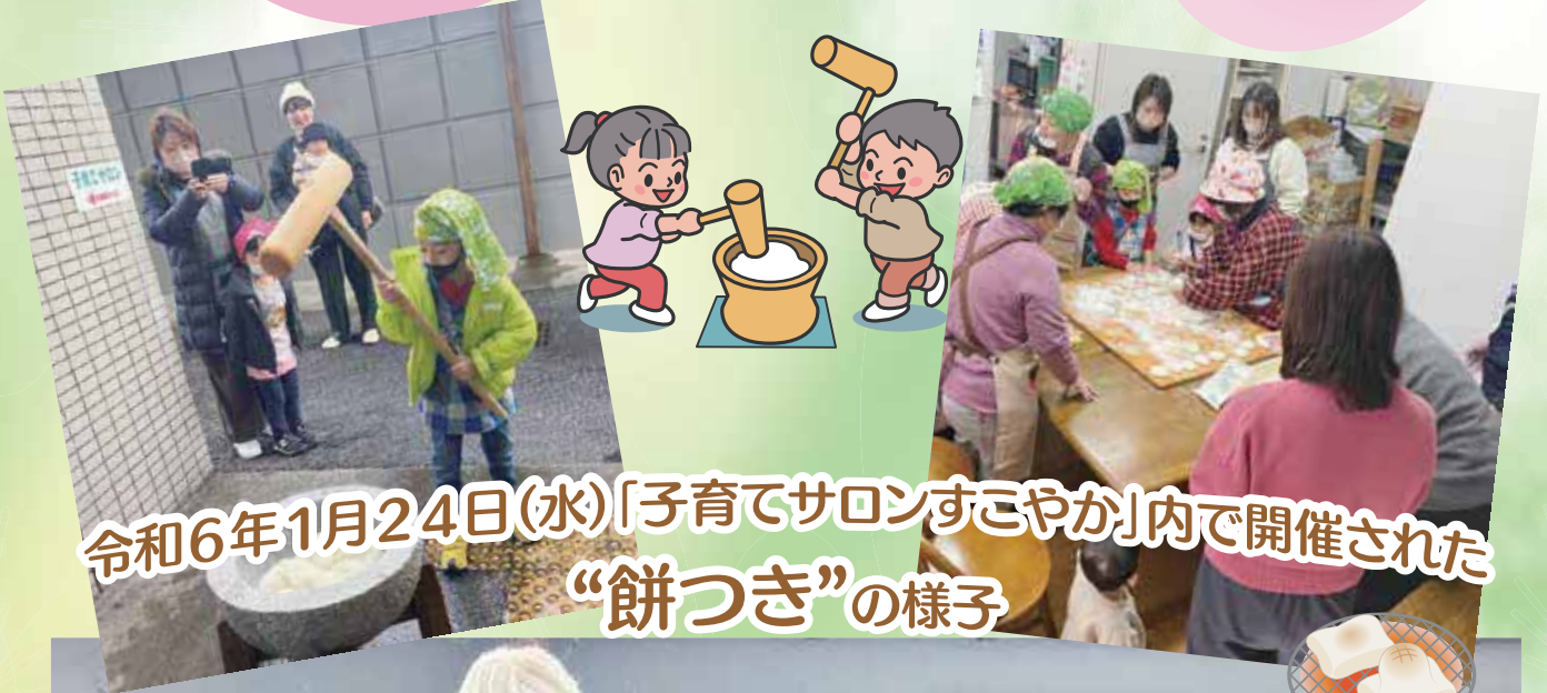
令和6年1月24日(水)「子育てサロンすこやか」内で開催された “餅つき”の様子