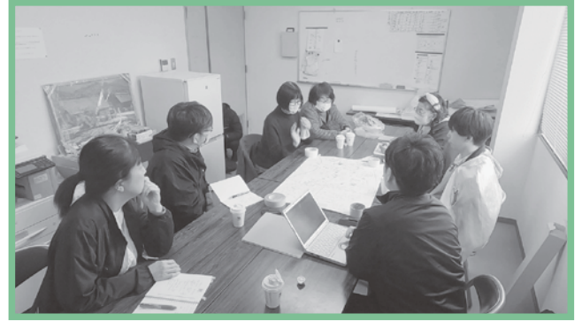
地域の困りごとを共有するためのマップ会議

この取り組みを進めて「子どもとの関わりが出来始めた」「委員としての活動がしやすくなった」といった声を頂いています。