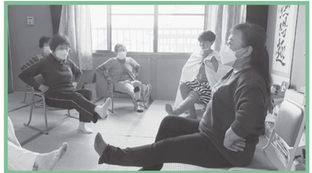
サロンでの体操指導をしています！

大切なみなさんのつどいの場が、地域でこの先もずっと続けることができるように、社協職員も応援させて頂いています。