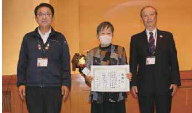
長年にわたり、社会福祉活動にご尽力いただき、ありがとうございました。

令和6年12月24日に、 令和6年度「大竹市社会福祉協議会会長表彰」を行いました。